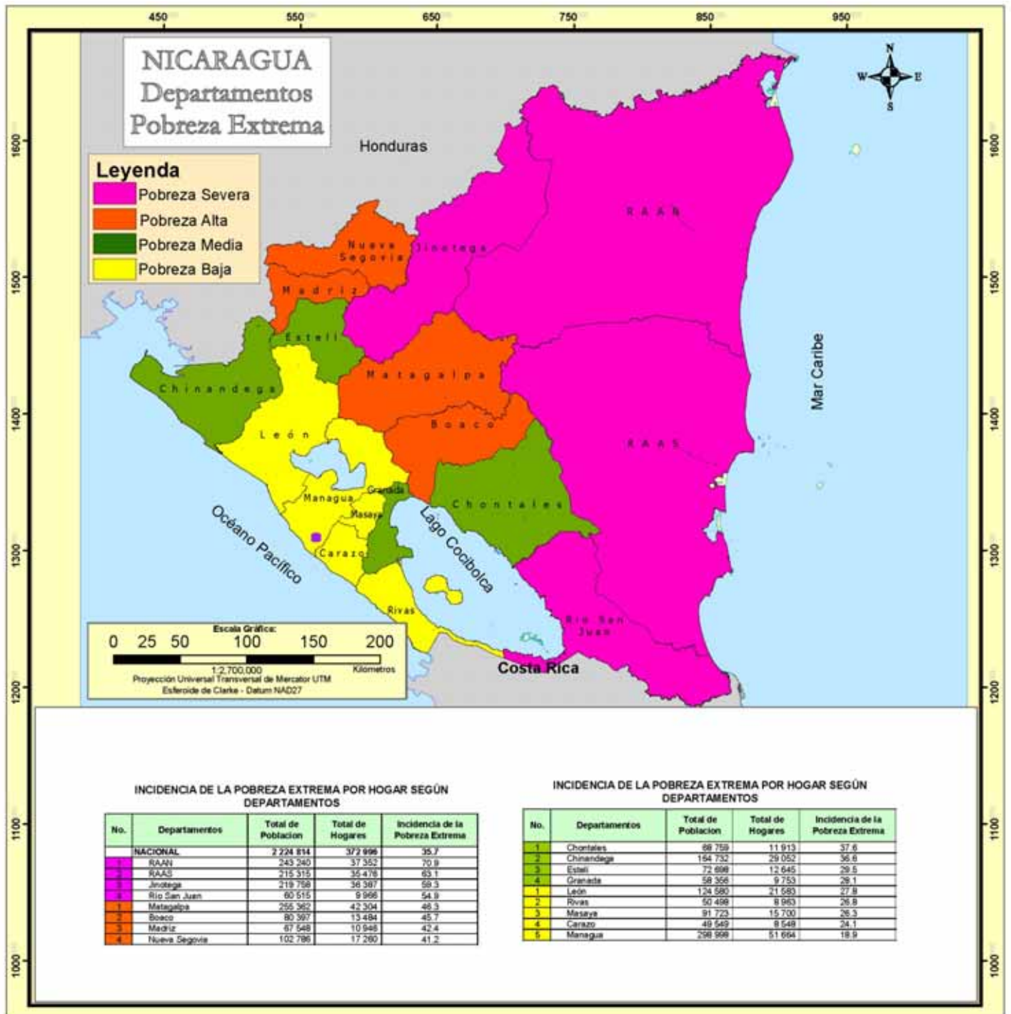
MAPA 1. INCIDENCIA DE LA POBREZA EXTREMA POR HOGAR SEGÚN DEPARTAMENTO